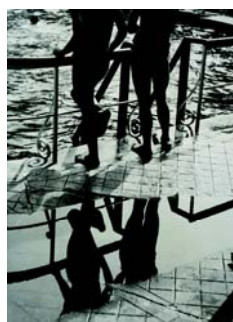
2. Grete Hubacher Aux bains, vers 1932 Tirage au gélatino-bromure d'argent