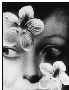
4. Binia Bill Sans titre, vers 1932 Tirage au gélatino-bromure d'argent