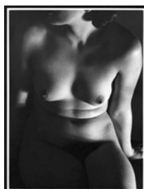
8. Germaine Martin Nu assis, années 1930 Tirage au gélatino-bromure d'argent