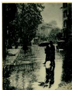
1. Heinrich Bauer Novembre, vers 1930 Oléobromie

http://www.museenational.ch/f/prangins/presse_documentation/pressedossiers.php ou sur demande à rachel.vez-fridrich@slm.admin.ch ou tél. + 41(0)22 994 88 68/90.