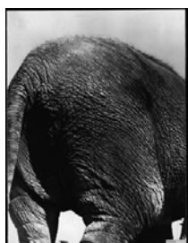
6. Gotthard Schuh Eléphant, vers 1930 Tirage au gélatino-bromure d'argent