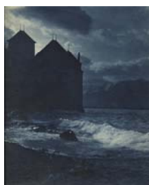
5. Rodolphe Schlemmer Château de Chillon, sans date Tirage à la gomme bichromatée