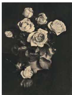
3. Heinrich Bauer Sans titre, vers 1930 Oléobromie